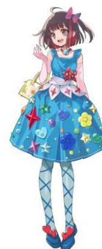
かこのちゃん©加古川市