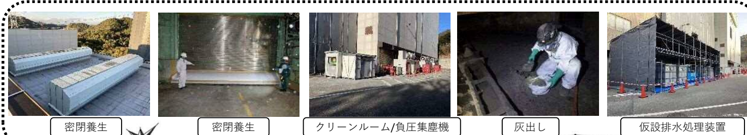
ダイオキシン類対策仮設・付着物除去工事