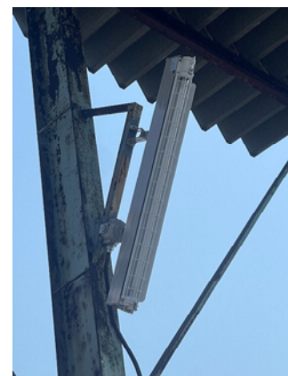
エ. 防爆型屋外灯のLED化