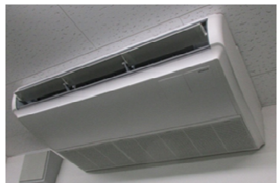
イ. 省電力エアコンに更新