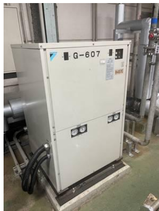
ア. 省エネタイプ冷凍機に更新