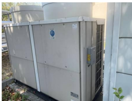
ウ. エアコンの間欠運転装置