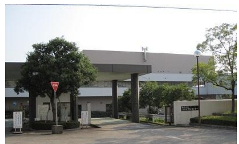
リサイクルセンター