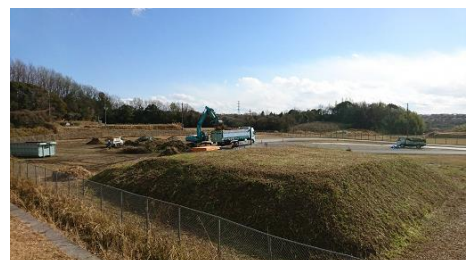
剪定枝等一時集積所