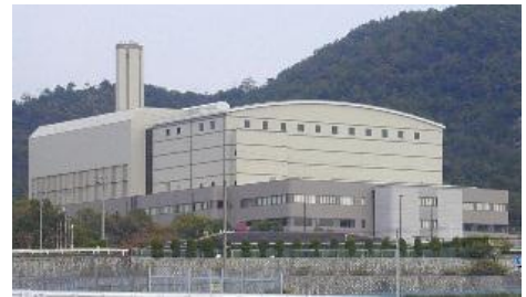
新クリーンセンター