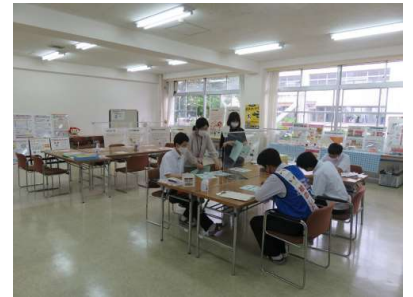
教室レイアウトイメージ