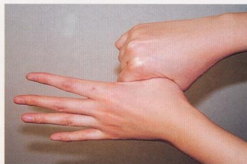
5. 親指と手掌をねじり洗いする