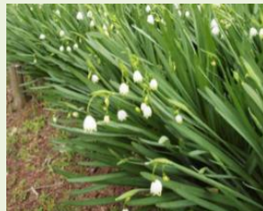
スノーフレーク (スズランスイセン)