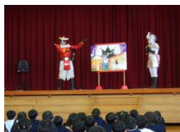
1・2年生 環境学習(サムライガー)