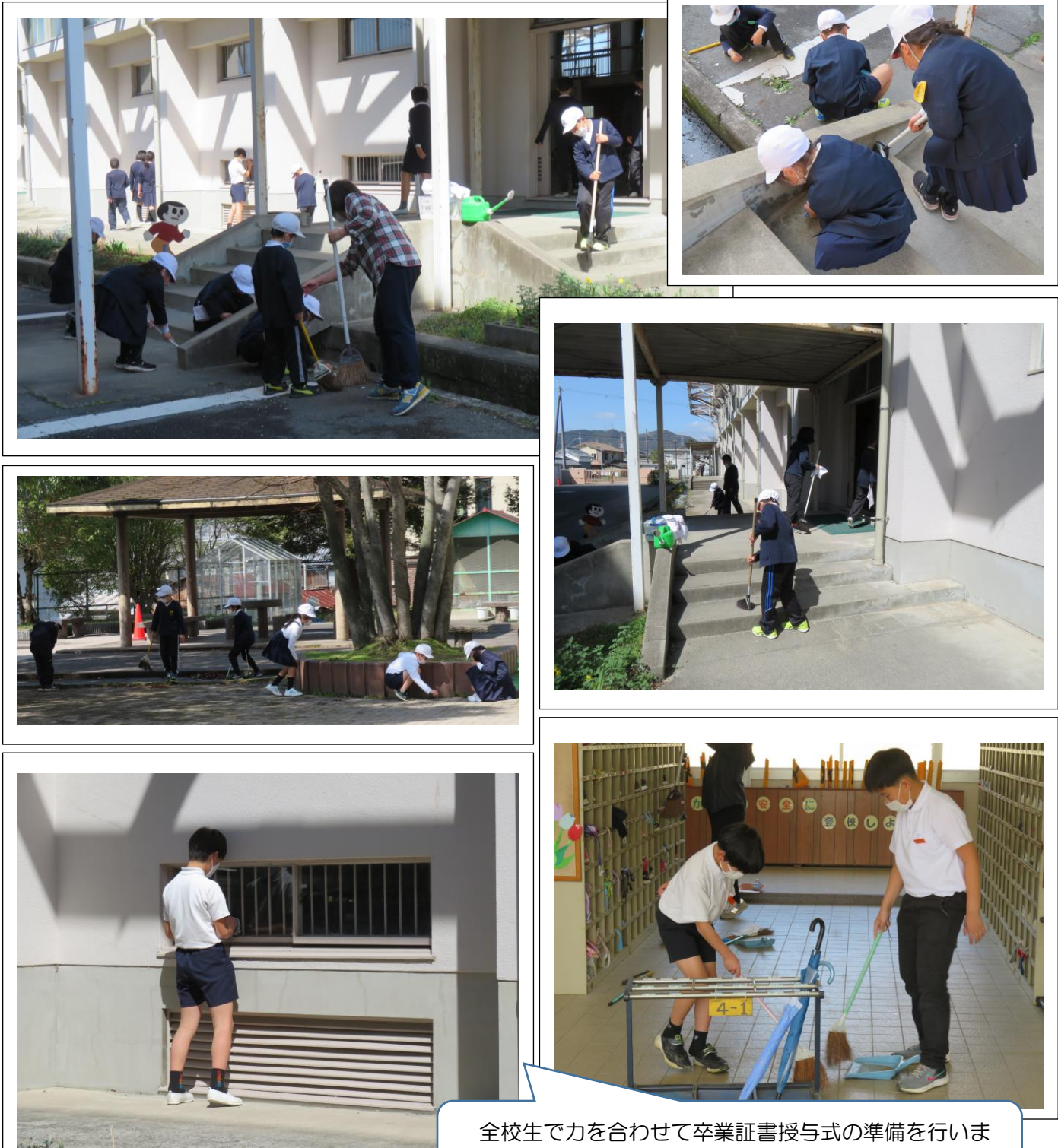
全校生で力を合わせて卒業証書授与式の準備を行いました。平荘っ子のみなさん、ありがとう。