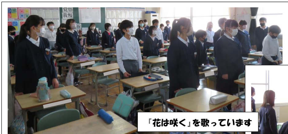
「花は咲く」を歌っています