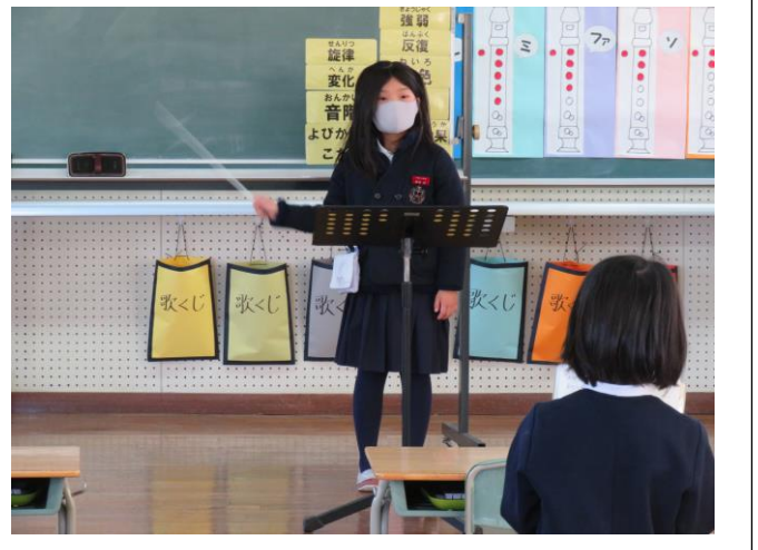
鍵盤ハーモニカの練習をしています

授業の初めに、子どもが指揮をしながら、『みんなのうた』の歌集から1曲を選び、みんなで歌います。指揮者も歌もくじ引きで決めます。