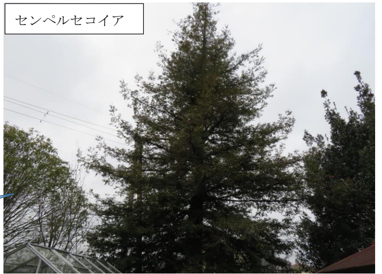
センペルセコイア

センペルセコイアは、針葉樹です。40mぐらいの大きな木に生長します。セコイアは、世界一大きくなる（背が高くなる）木です。今の時期でも緑のセンペルセコイアは、常緑樹です。 メタセコイアは、針葉樹ですが葉が落ちるので落葉樹