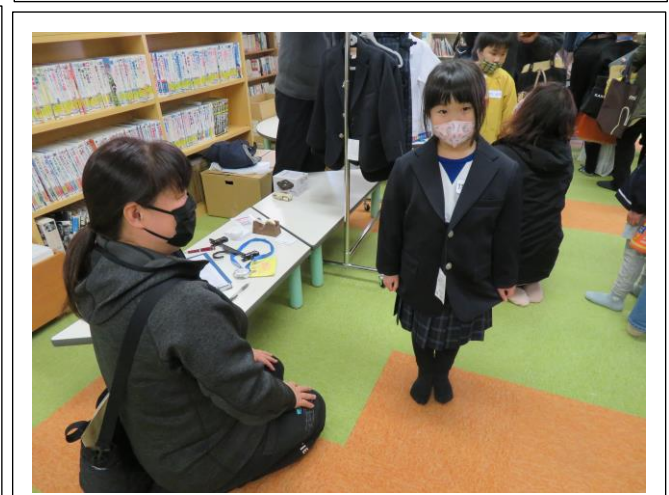
両荘みらい学園の標準服です。（移行期です）