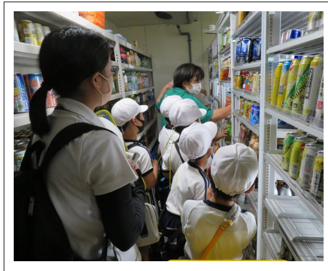
↑セブンイレブンで、お茶の補充を体験しています。