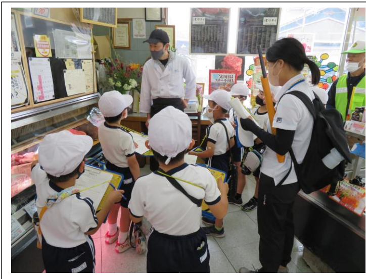
↑うらい精肉店で、質問をしています。