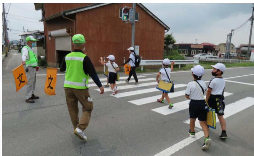
安全な横断歩道の渡り方や歩道の歩き方を、町たんけんをしながら確認しました。