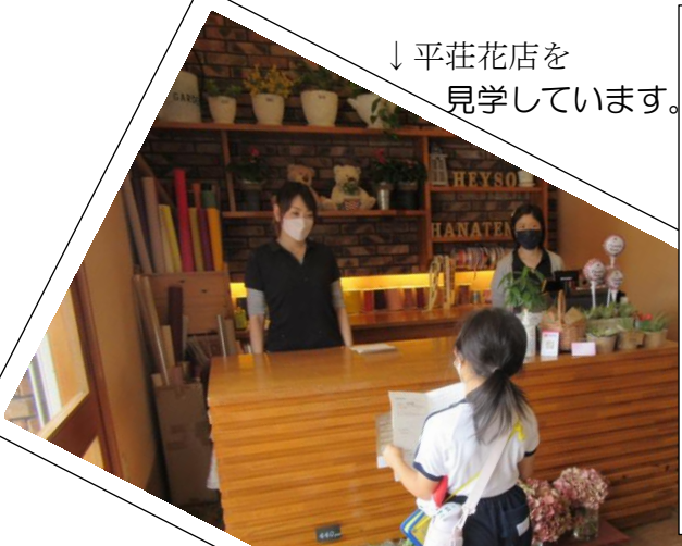
↓平荘花店を 見学しています。