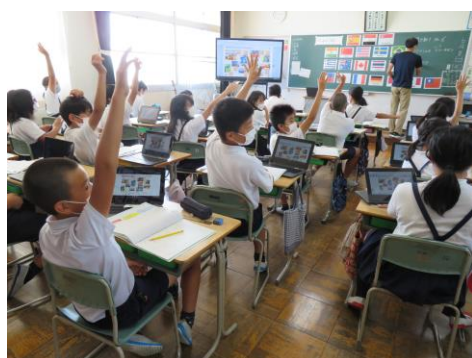
6年生の外国語の様子です。