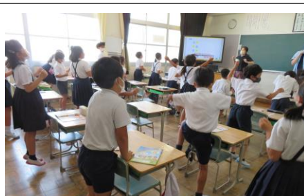
3年生の外国語活動の様子です。