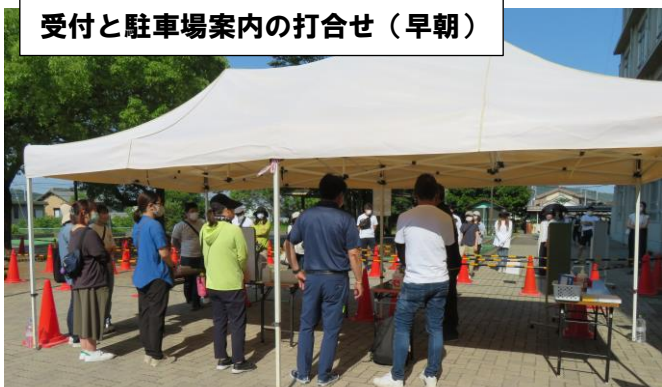
受付と駐車場案内の打合せ（早朝）

まだまだ新型コロナウイルス感染防止対策は続いています。そこで、運動会をスムーズに進行できるよう、PTA 役員の皆様に駐車場案内や受付のご協力をいただきました。どうもありがとうございました。運動会終了後には片付けも手伝っていただき、大変助かりました。ありがとうございました。