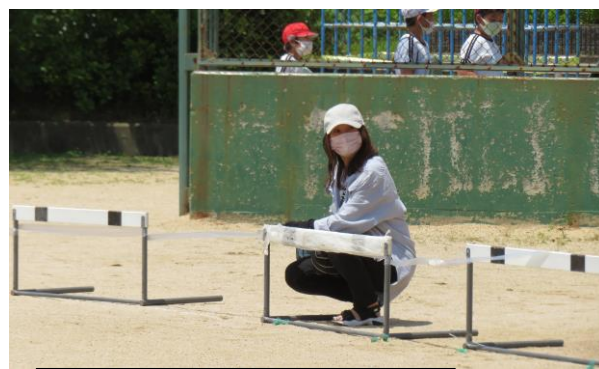
運動会終了後の片付けの協力