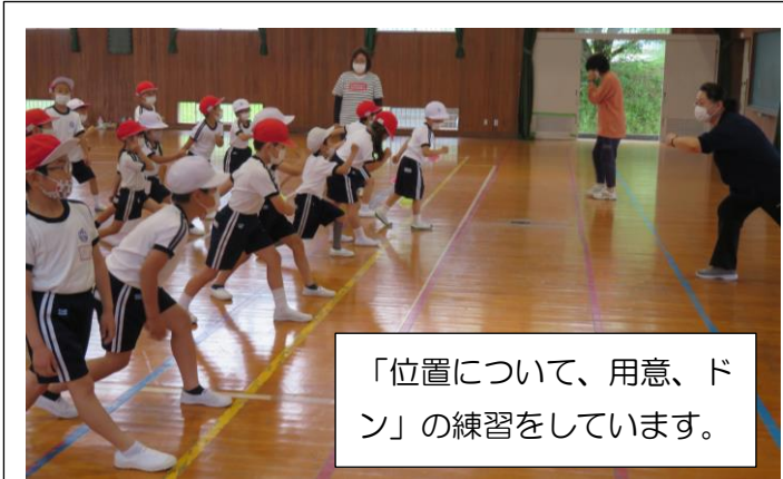
「位置について、用意、ドン」の練習をしています。

1年生にとっては、初めての運動会です。2年生が見本を示しながら、1・2年生の徒競走の練習を一生懸命に取り組んでいます。