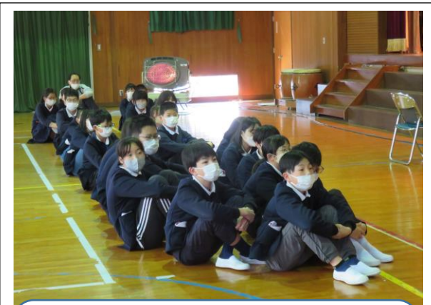
6年生を担当された先生方(異動で他校に行かれています)から、6年生にお手紙が届きました。5年生が代読して紹介しました。