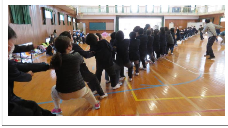
【平荘綱引き】 1回戦は5年生女子対6年生女子で、2回戦は5年生男子対6年生男子で行いました。そして、最後の3回戦は5年生対6年生で行いました。3回戦とも6年生が勝ちました。 勝ち負けよりも、けがなく、思いっきり体を使って楽しめたこと(全力で力を発揮できたこと)が良かったです。1~4年生も、精一杯の応援ができました。