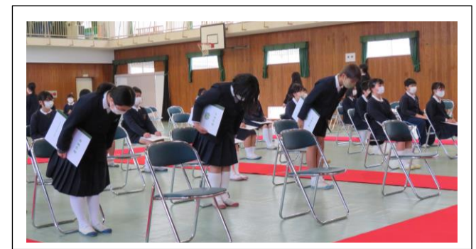
昨日は、卒業式の予行を行いました。心のこもったよい卒業式になるように練習をしています。