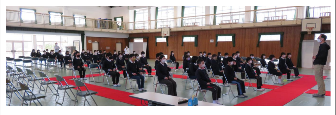
《返事の練習をしています》全員で返事の練習をした後、返事対決をしました。

3月11日（金）から、6年生は卒業式の練習を開始しました。一昨日からは、5年生も練習に参加しています。短い練習期間ですが、集中して練習を行い、3月23日に向けて心の準備もしています。