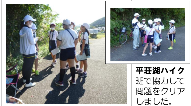
平荘湖ハイク 班で協力して 問題をクリア しました。