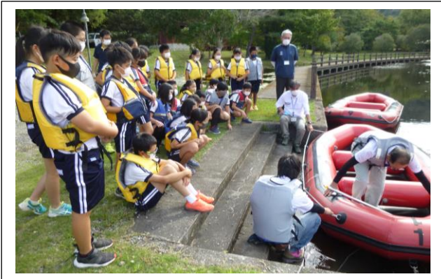
9月29日午前中：ボート体験