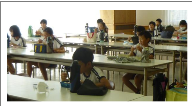
食堂でお弁当タイム