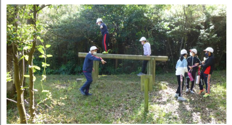
👉 アスレチック体験 👉 焼き板づくり