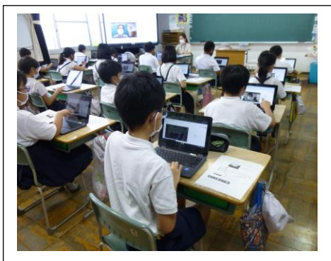
👉 5年生の授業 ※meetで、発言する練習をしています。