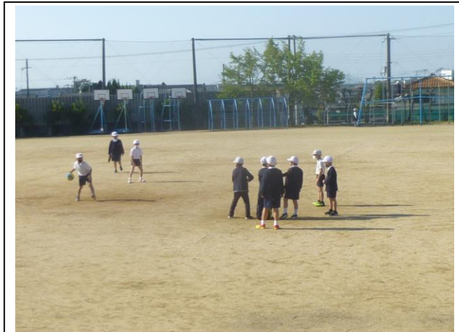
《朝の子どもたちの様子》

安全に気をつけて、登校ができています。日を追うごとに、高学年の下級生を気遣う関わりをよく目にします。大変優しいです。