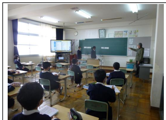
《理由を添えて発言をしています》

算数の学習です。数字カードを使って小数の大きさを考えています。理由を述べながら、自分の考えを発言できています。（「30に近い小数はどっちかな？」）（5年生）