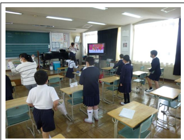
《いぶき・わかば学級》

音楽の学習の様子です。体全体を使って身体表現をしています（左）。鑑賞の学習で、曲を聴いて曲の感じが変わったところで手を挙げて合図を送っています（右）。