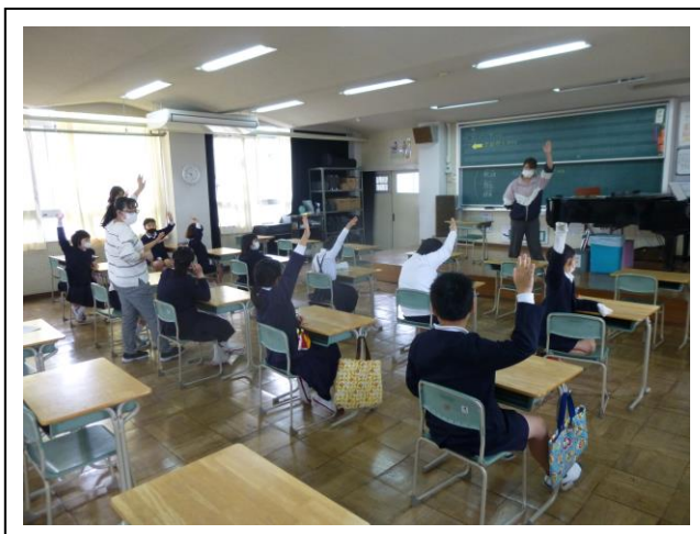
《大型モニターを使って学習をしています》

音楽の学習の様子です。体全体を使って身体表現をしています（左）。鑑賞の学習で、曲を聴いて曲の感じが変わったところで手を挙げて合図を送っています（右）。