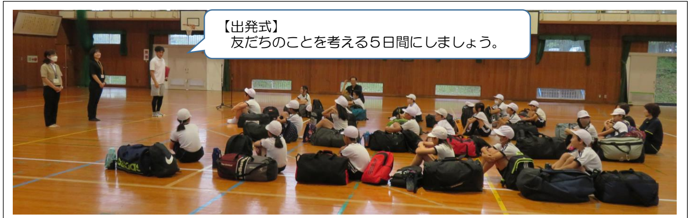
【出発式】 友だちのことを考える5日間にしましょう。