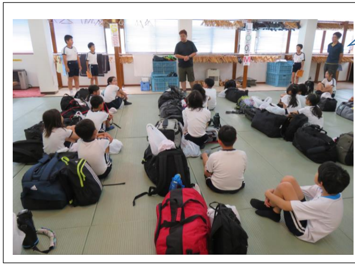
【入所式】青い鳥のとっちゃんとの出会いです。5日間お世話になります。