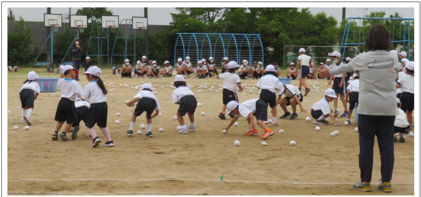
全員写真の場所の確認をしました