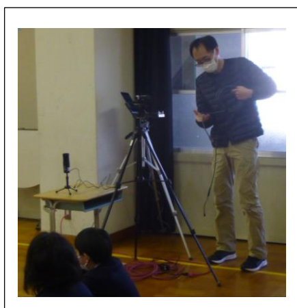
リモートの動作確認を行いました。多目的室・職員室・5年生の教室でテストを行いました。