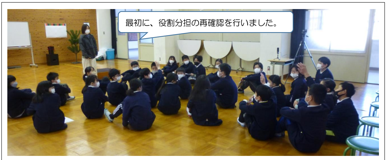
最初に、役割分担の再確認を行いました。

3月4日(金)の6年生を送る会は、リモートを利用して行います。6年生は多目的室に入場し、各学年は教室からメッセージを届けます。その6年生とそれぞれの学年をつなぎながら司会進行をしてくれるのが5年生です。6年生が喜んでくれるように、真心を込めてリハーサルを行っていました。