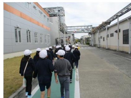
建物がたくさんありました