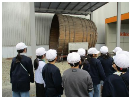
大きなしょうゆたる