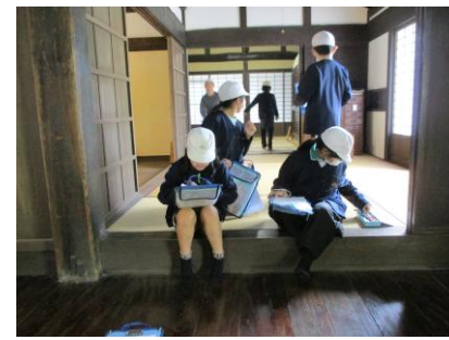
部屋もたくさんありました