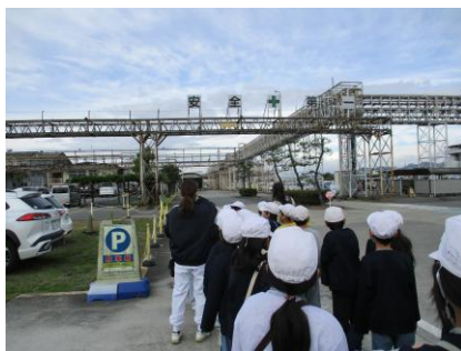
工場の設備の説明