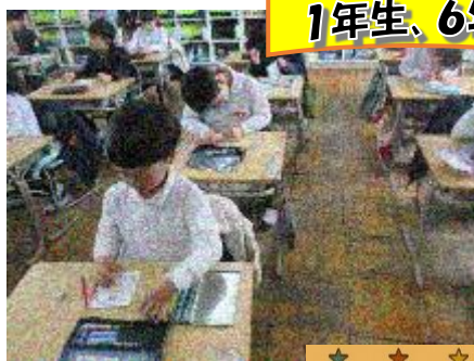
1年生、6年生を送る会にむけて・・・