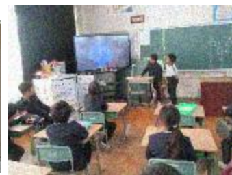
2年生、朝の会での係活動