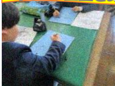
4年生、図工での木版画