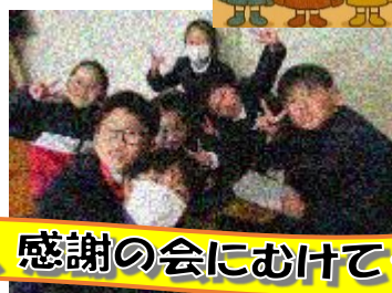
3年生、感謝の会にむけて・・・