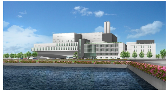
▲ Eco cleanpeer Harima

Rác cháy được, rác không cháy được và rác quá khổ của thành phố Kakogawa được xử lý bởi Eco cleanpeer Harima (Khu vực sở tại: 6-1-1 Umei, thành phố Takasago) do hai thành phố và hai thị trấn quản lý (thành phố Kakogawa, thành phố Takasago, thị trấn Inami, và thị trấn Harima).