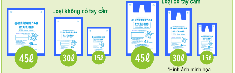
*Hình ảnh minh họa

Chúng tôi sản xuất loại không có tay cầm và loại có tay cầm với 3 kích cỡ.