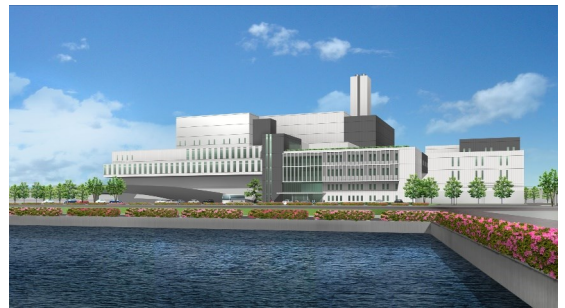
▲ Eco cleanpeer Harima

La basura combustible, la basura no combustible y la basura de gran tamaño de la ciudad de Kakogawa serán procesadas en Eco cleanpeer Harima operadas por dos ciudades y dos pueblos (la ciudad de Kakogawa, la ciudad de Takasago, el pueblo de Inami y el pueblo de Harima). Dirección: 6-1-1 Umei, ciudad de Takasago.