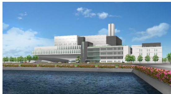
▲ Eco cleanpeer Harima

Os lixos incineráveis, não-incineráveis e de grande porte da cidade de Kakogawa são recolhidos pela Eco cleanpeer Harima (Endereço: Takasago-shi, Umei-cho 6 chome 1-1), co-gerenciado pelas cidades de Kakogawa e Takasago, e pelas vilas de Inami e Harima.