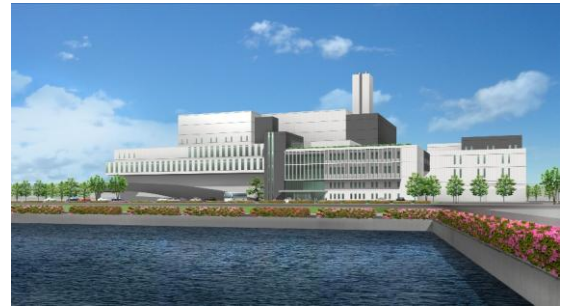
▲에코 크린피아 하리마

가코가와시에서 발생하는 소각 쓰레기 · 비소각 쓰레기 · 대형쓰레기는 2개시 2개정(가코가와시 · 다카사고시 · 이나미초 · 하리마초)이 운영하는 에코 크린피아 하리마(주소 : 다카사고시 우메이 6초메 1-1)에서 처리합니다.