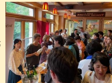
海外での試飲会出席