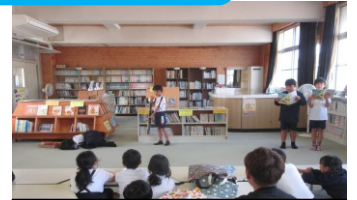
児童の読み聞かせ