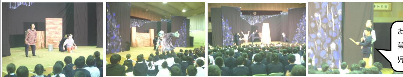
お礼の言葉。東小児童会長

毎年ゴールデンウィークの狭間で合同芸術鑑賞会を実施しています。今年度は観劇です。京都から「劇団 風の子」を招きました。プロの劇団であり、全国の学校で公演されています。この日、会場の志方小学校体育館のフロアに扇型で特設舞台と観客席を設けての上演となりました。その準備だけでも当日早朝から3時間以上かけられていました。目の前で繰り広げられた「生」の演劇は迫力がありました。見事な演技力と空気感で子どもたちは劇の世界にひきこまれていきました。主人公が小学生の設定も魅力的でした。生の劇を通して、新たな発見や気づきがたくさんあったことでしょう。素晴らしい芸術鑑賞ができました。