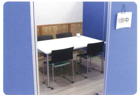
▲ プライバシーに配慮した相談スペース