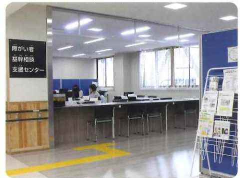
▲ 受付窓口です お気軽にお声かけください

プライバシーに配慮するため、相談室を設置しています。 個人情報は、相談者の同意の上で適切に取扱います。