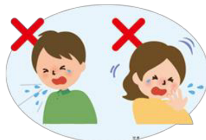
何もせずに咳やくしゃみをする 咳やくしゃみを手でおさえる