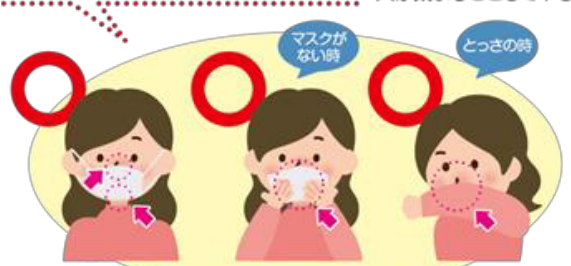
マスクを着用する（口・鼻を覆う） ティッシュ・ハンカチで口・鼻を覆う 袖で口・鼻を覆う