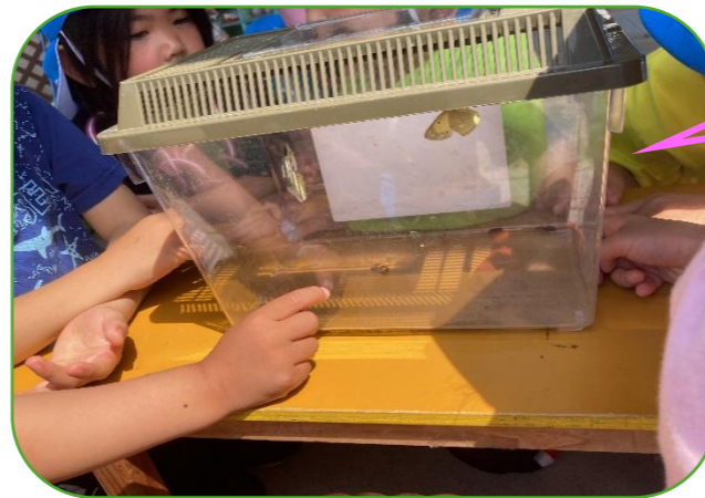
見て！モンシロチョウとモンキチョウ♪