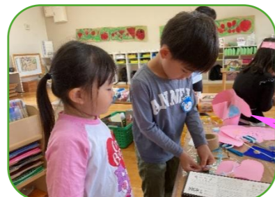
ちょっと待ってな！