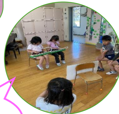
ピアノでチョウチョ弾くよ！聞いててね♪