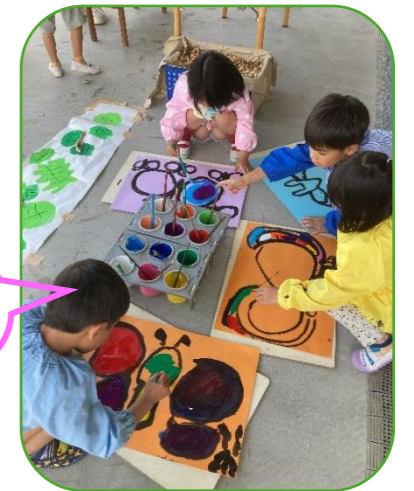
こんなチョウチョが生まれたら嬉しいな

チョウチョを捕まえることから色や羽の形、飛び方や動きへと興味が広がり自分なりの表現の仕方を楽しむようになりました。その中で、友達という喜びや楽しさ、異年齢児に合ったかわり方を考えたり知ったりする機会となりました。ダンスやピアノ遊びでは友達と同じ目当てをもって「こうした方がかわいい」「ここを押さえるねん」など言いながら楽しんでいました。アゲハチョウの卵や幼虫に続き、アオスジアゲハの幼虫やさなぎを見つけたことは、さらに生き物に関心をもち面白さや不思議さを感じることに繋がる素敵な出会いとなりました。