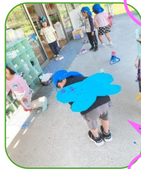
チョウチョお花に止まって休憩中

幼稚園に飛んできたアオスジアゲハ…卵や幼虫を探したい！小学校へ出発！見つけたさなぎと幼虫、卵をクラスで大切に育てることになりました。