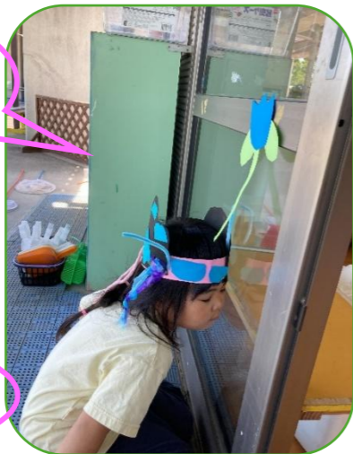
見て！この羽♪素敵でしょ～