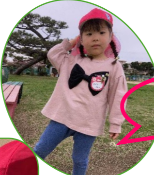
お花でおしゃれ しちゃおう！