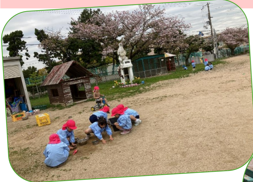
園庭に出ると、ほし組の時に見つけた好きなことや、新たに興味をもったことで早速遊び始めました！