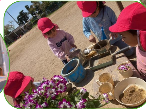
あたたかくなって、園庭には色とりどりの花やダンゴムシ、チョウチョがいっぱい！たくさん見付けて心わくわく！笑顔があふれています♪