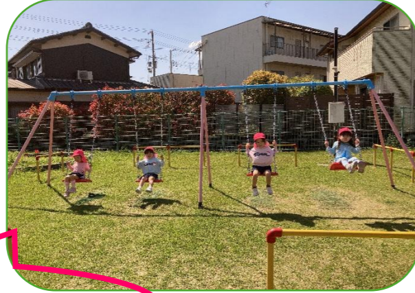
お友達とすると、もっと楽しい！