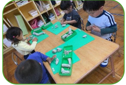
お部屋でも好きなことをたくさん見付けて遊んでいます。安心できる場所で、先生や友達との関わりも楽しんでいけるよう支えていきたいです。