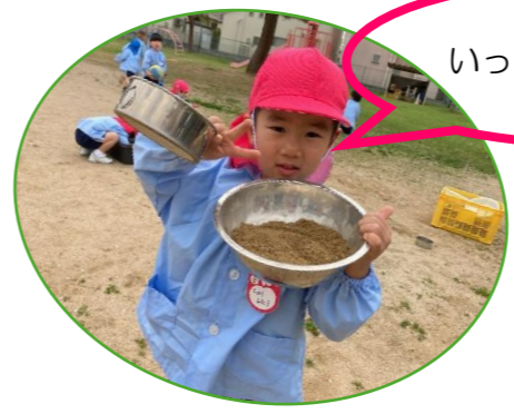
いっぱいできたよ☆