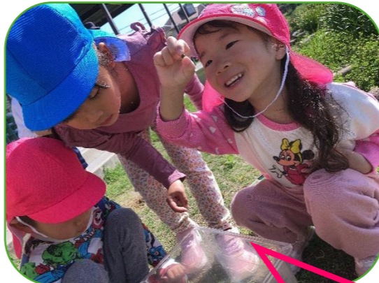
ダンゴムシが丸くなった！ かわいいね♪