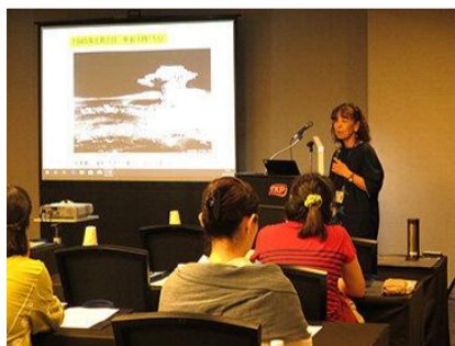
国立広島原爆死没者追悼平和祈念館ホームページ ( https://www.hiro-tsuitokenkan.go.jp/project/successors/ )