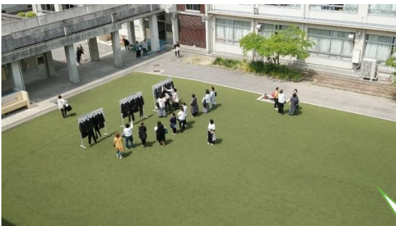
新制服のモデルプランを展示しました。多くの保護者の方から「かわいいー」の音が・・・