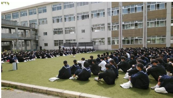
美しい芝生の中庭を利用し、新型コロナウイルス対策をとりながら、実施しました。