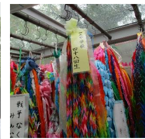
平和記念公園での平和集会