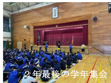
2年最後の学年集会

令和8年度、第1学期が始まりました。いよいよ義務教育の最後の年のスタートです。そして今日は、新しいクラスのメンバーが顔を合わせる日です。ここから3年生がスタートします。1年生から2年生になった1年前とはちがい、3年生は浜の宮中学校の「顔」となります。校内、校外での一つひとつの行動に責任が重くかかってくるのです。さらに、進路決定に向けて自分自身を成長させていく時期でもあります。希望の進路に向けて、そ