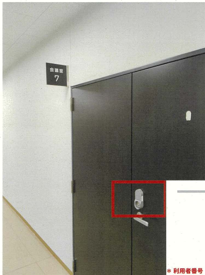
テンキーによる解錠