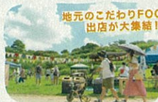
地元のこだわりFOODの 出店が大集結!