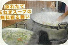
採れたて 玉ねぎスープの 無料配布開催!