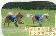
ワンちゃんと遊べる ドッグマルシェ

地元農家さんの採れたて野菜の販売や、こだわりの飲食ブース、アウトドアを楽しめるワークショップなどコンテンツが盛り沢山!! ローカルのおいしい!たのしい!が詰まったイベントです。