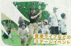
音楽ライブなどの ステージイベント