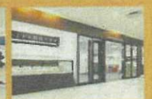
かこがわ将棋プラザ