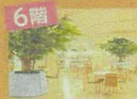
市立加古川図書館