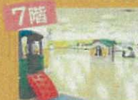
加古川駅南 子育てプラザ