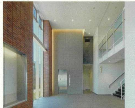
▲展示コーナーを設けた消防署