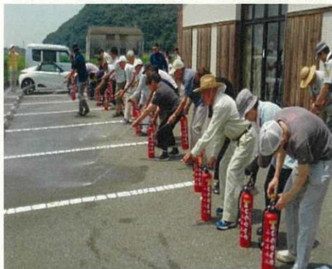
▲地域で消火訓練を実施