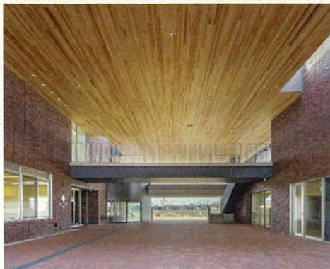
▲溜まり空間となるプロムナード