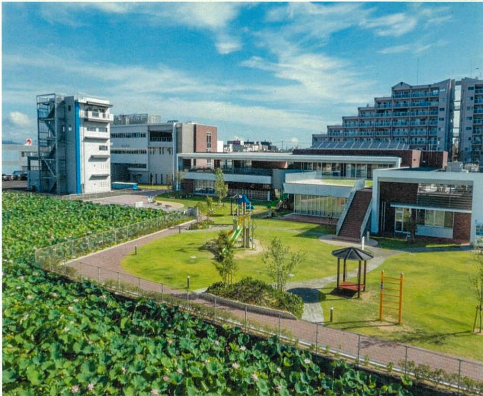
▲隣接するハス池と視覚的なつながりを生み出す配置計画