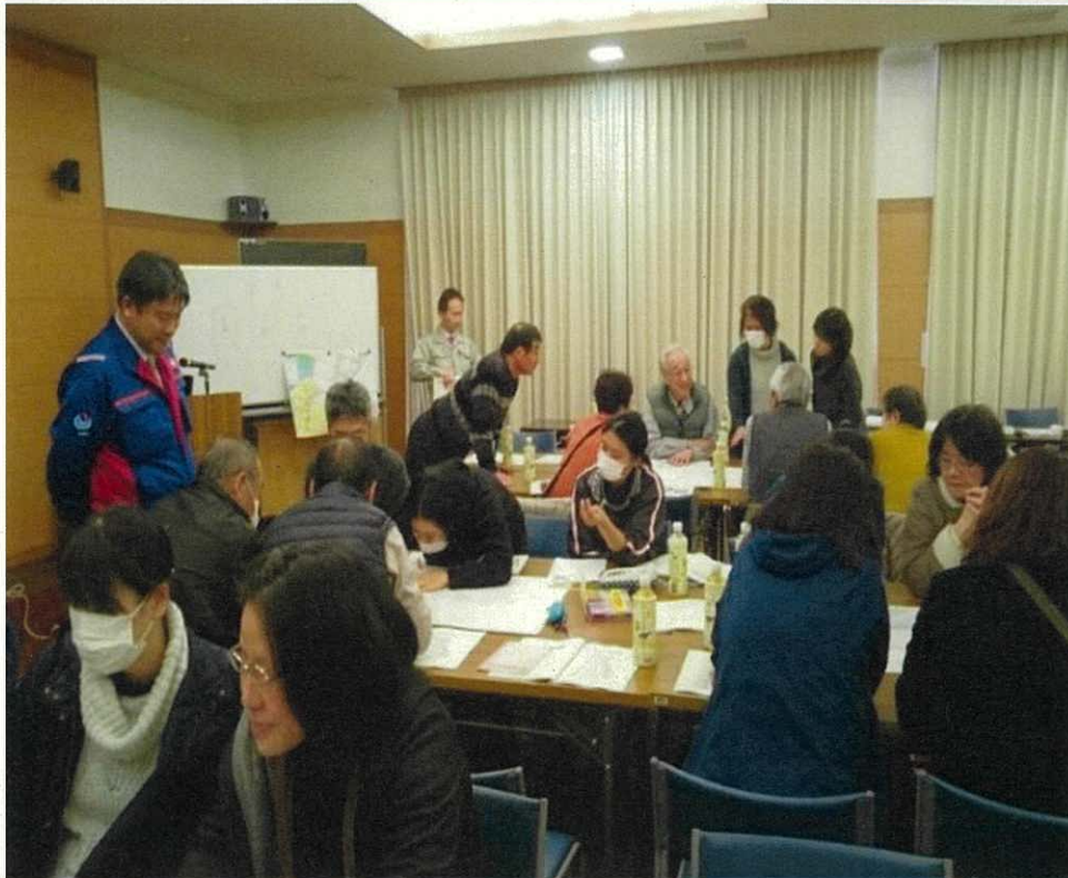
▲防災マップ・防災マニュアルを作成