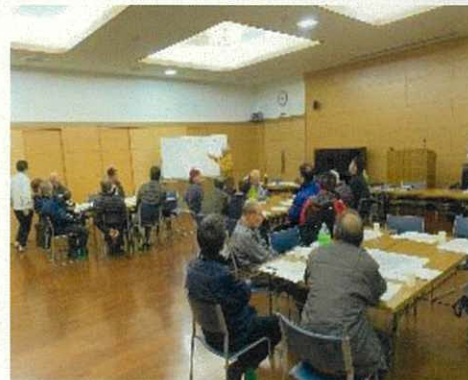
▲地区まちづくり計画策定の様子