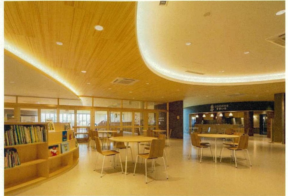
▲地域交流スペースを兼ねたエントランスホール