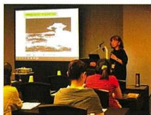
国立広島原爆死没者追悼平和祈念館ホームページ ( https://www.hiro-tsuitokenkan.go.jp/project/successors/ )