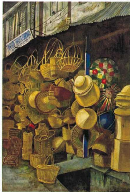
奥村文子「路地裏の店」(日本画) 加古川市所蔵