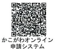
かこがわオンライン申請システム

◆申込方法 電話・FAX (下記の申込書を使用) で男女共同参画センターへ、またはかこがわオンライン申請システムより申込み (キーワード「企業向け」で検索)