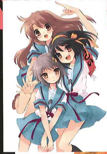
涼宮ハルヒの憂鬱